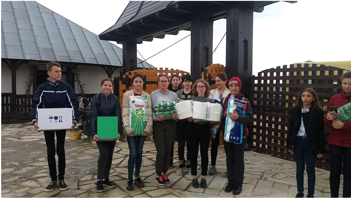
Iată-ne ajunși și la „Schitul Groși”, județul Neamț!